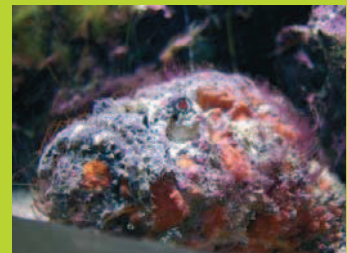
Un poisson pierre

Observer les animaux dans leur milieu de vie