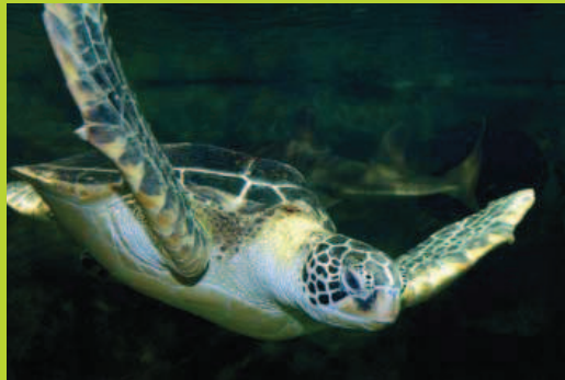
une tortue marine